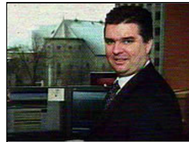
Le PDG de Norbourg, Vincent Lacroix, est soupçonné de fraude. (Journal <i>Les Affaires</i>, photo de Gilles Delisle)

Pour illustrer son propos, Fabien Major a comparé la gestion de deux fonds autrefois gérés par Montrusco: celui d'Évolution Québec, géré par Norbourg depuis l'an dernier, qui a enregistré un rendement de 0,5 % au cours des 12 derniers mois, et le fonds Northwest, toujours géré par Montrusco, qui enregistre une croissance hors du commun et un rendement de près de 30 %.